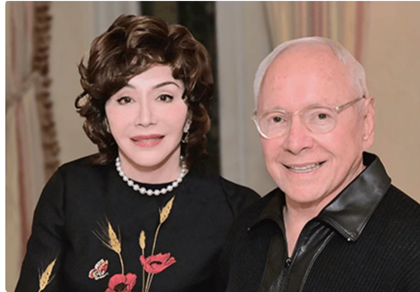
ע"ש סטיוארט ולינדה רזניק